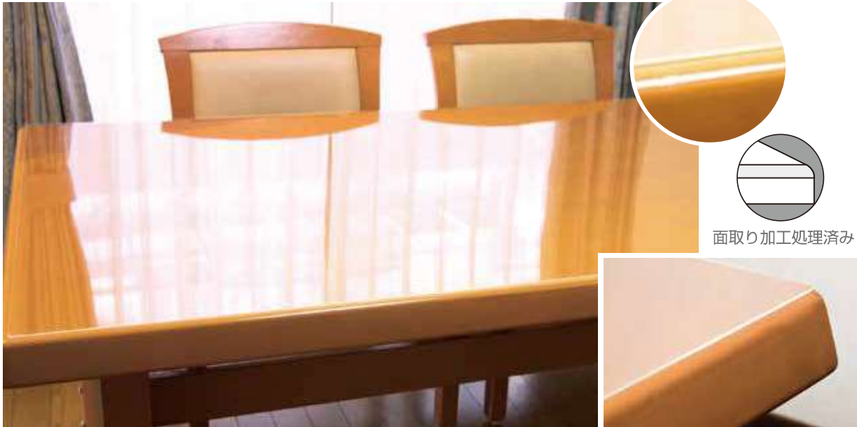
面取り加工処理済み